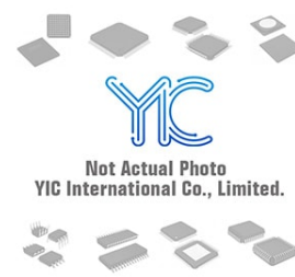
BU2173F-E2 ROHM ROHM SOP