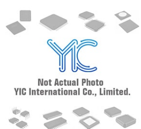
BU2190F-E2 ROHM ROHM SMD-8