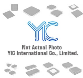
BU2152FV-E2 ROHM ROHM TSSOP