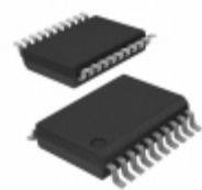
PCA9554ATS,112 NXP USA Inc. IC I/O EXPANDER I2C 8B 20SSOP