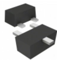
DA3S101A0L Panasonic DIODE GEN PURP 80V 100MA SSMINI3