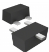
DA3S102D0L Panasonic DIODE ARRAY GP 80V 100MA SSMINI3