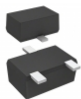
DA3J107K0L Panasonic DIODE GEN PURP 300V 100MA SMINI3