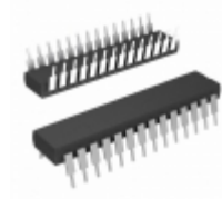
MCP23017-E/SP Micrel / Microchip Technology IC I/O EXPANDER I2C 16B 28SDIP