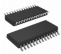
MCP23016T-I/SO Micrel / Microchip Technology IC I/O EXPANDER I2C 16B 28SOIC