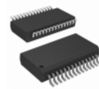
MCP23017-E/SS Micrel / Microchip Technology IC I/O EXPANDER I2C 16B 28SSOP