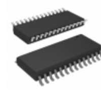
MCP23017-E/SO Micrel / Microchip Technology IC I/O EXPANDER I2C 16B 28SOIC